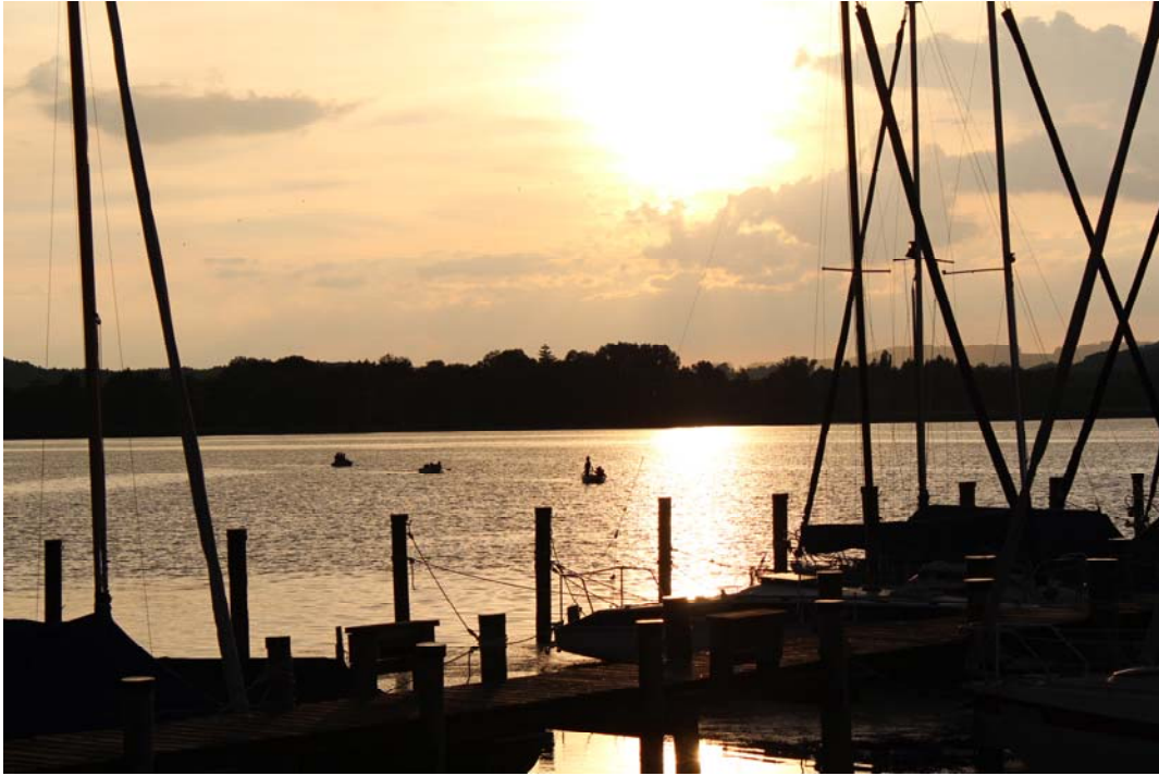
Doch wieder alle da!!!