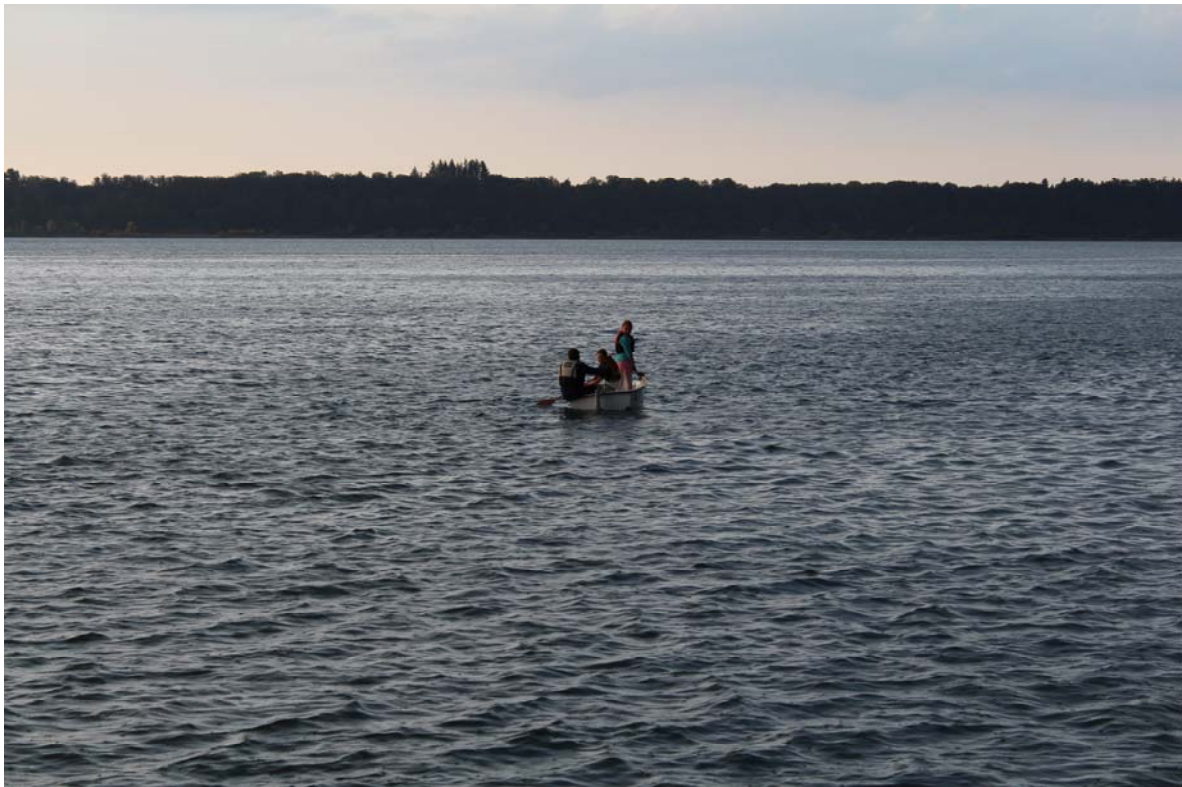
Opti in Seenot im Abendrot ...