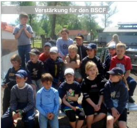
Verstärkung für den BSCF

Von den 3 Mädchen und 12 Jungen sind 10 Kinder dem Club beigetreten, die zukünftig die BSCF-Truppe rund um die Bayerischen Seen schlagkräftig ergänzen.