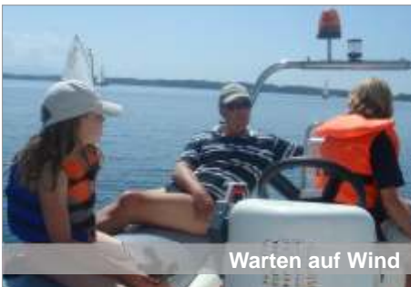
Warten auf Wind