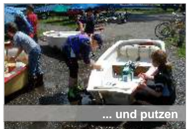
... und putzen