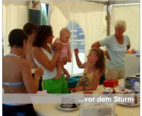
...vor dem Sturm