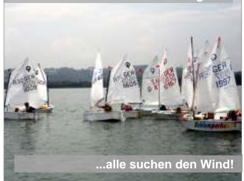
...alle suchen den Wind!