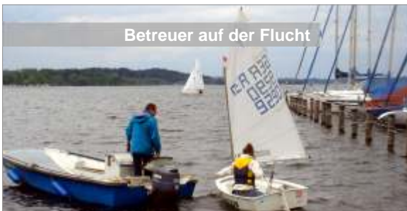
Betreuer auf der Flucht