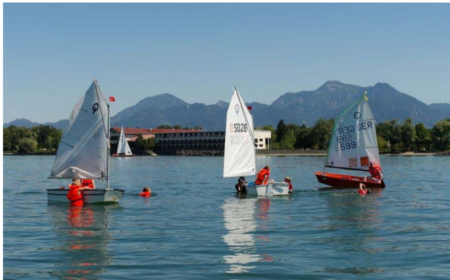
Bernauer Ferientag im August