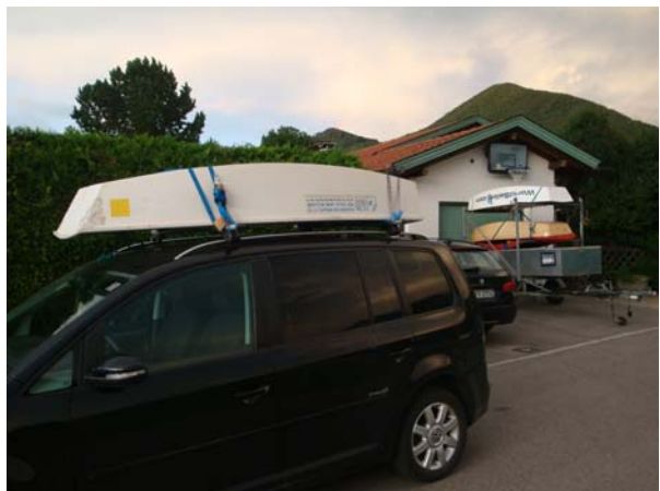
Optis auf Reisen