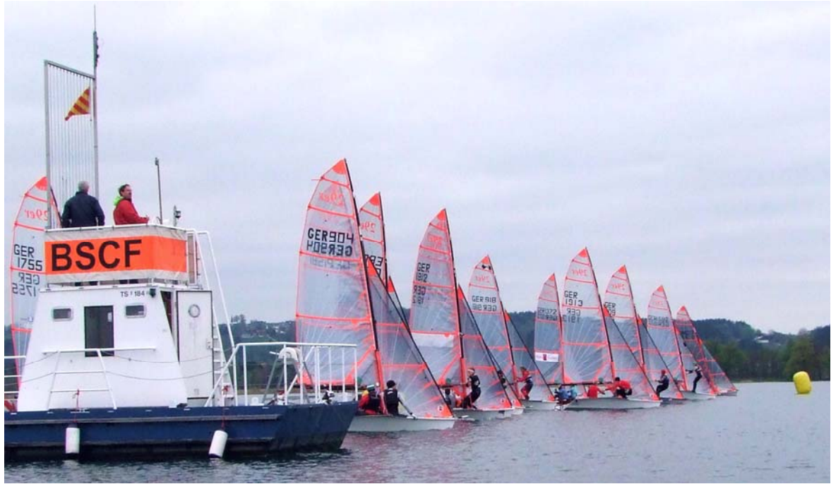
29er Alpenland Trophy