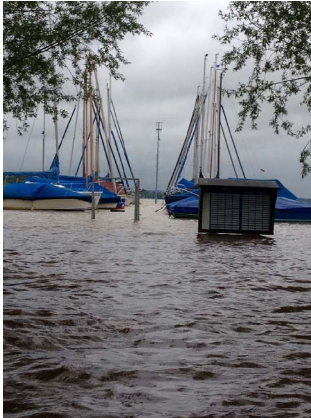
Clubgelände mit Hochwasser im Juni